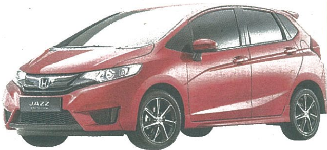
הונדה ג'אז. בממלכה מיוצרת