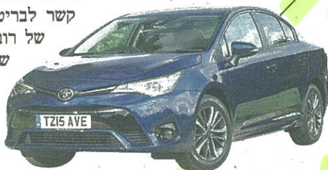
טויוטה אוריס. באה לישראל מבריטניה