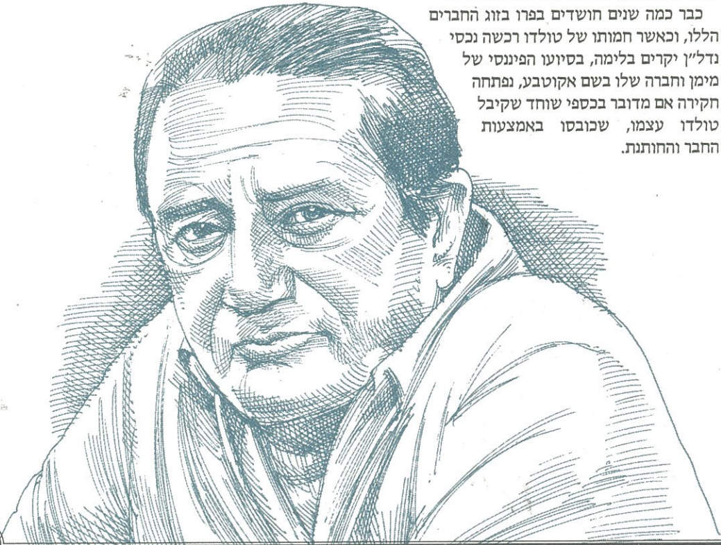
איורים: גיל גיבלי

להעברת כספי שוחד לטולדו. מוקדם יותר השנה, הציגה התביעה הפרואנית העברה בנקאית של סכום צנוע יותר, כ-91 אלף דולר, שהגיע דרך חברת קש מחברת תשתיות ברזילאית אחרת, קמרגו קורראה, לחשבון בנק בלונדון של חברה שהתבררה כשייכת למימן. גם כאן מדובר בחשד להטיית מכרו בתחום בניית רשת הכבישים. כבר כמה שנים חושדים בפרו בזוג החברים הללו, וכאשר חמותו של טולדו רכשה נכסי גדלין יקרים בלימה, בסיועו הפיננסי של מימן וחברה שלו בשם אקוטבע, נפתחה חקירה אם מדובר בכספי שוחד שקיבל טולדו עצמו, שכובסו באמצעות החבר והחנות.